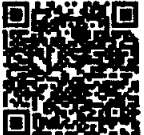
เอกสารแนบ

กลุ่มงานยุทธศาสตร์และสารสนเทศ งานพัฒนาระบบบริการสุขภาพ โทร ๐ ๕๓๘๙ ๐๒๓๘ - ๔๐ ต่อ ๑๐๓ โทรสาร ๐ ๕๓๘๙ ๐๒๔๑